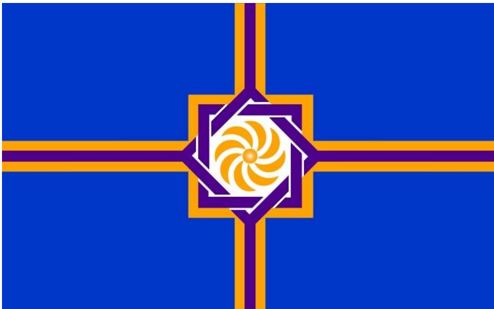
Флаг Республики Западная Армения