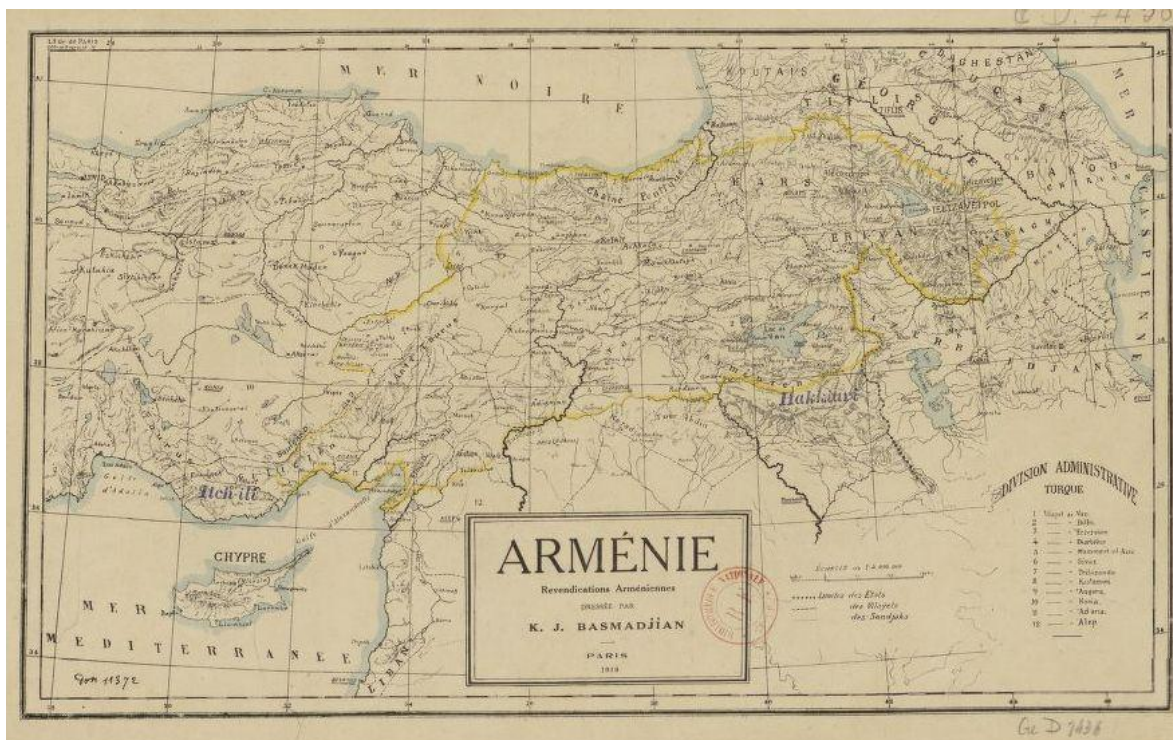
Этнографическая карта Армении