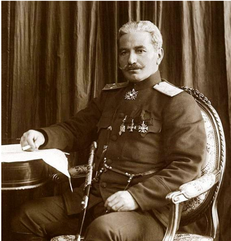
Полководец (Зоравар) Андраник