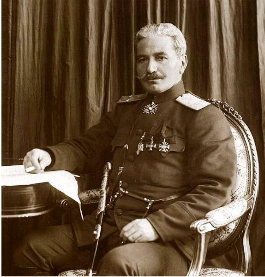
Commandant (Zoravar) Andranik