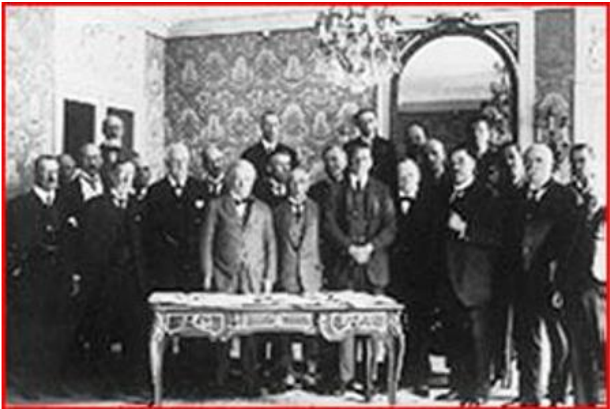
Membres participants au Traité de Paix de Sèvres