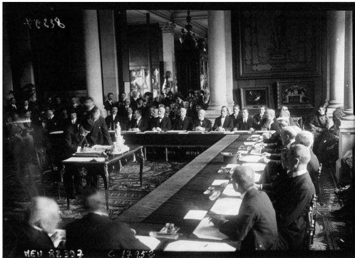
La délégation turque apposant sa signature au bas du Traité de Pais de Sèvres